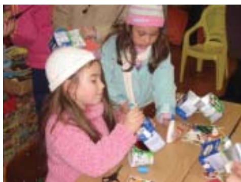
"Nas férias pinte aqui!" são oficinas ótimas para crianças

Nas férias, pinte aqui! - São oficinas especiais para períodos de férias escolares, tanto de inverno quanto de verão. Assim como as oficinas temáticas, também são gratuitas e os interessados devem fazer agendamento prévio.