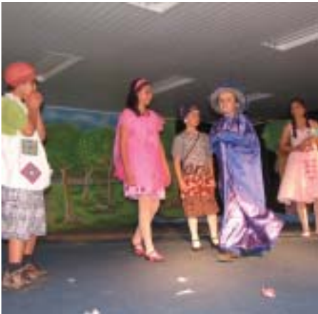
O Coração da Terra é Verde mais uma vez surpreendeu pela grande produção e excelente texto