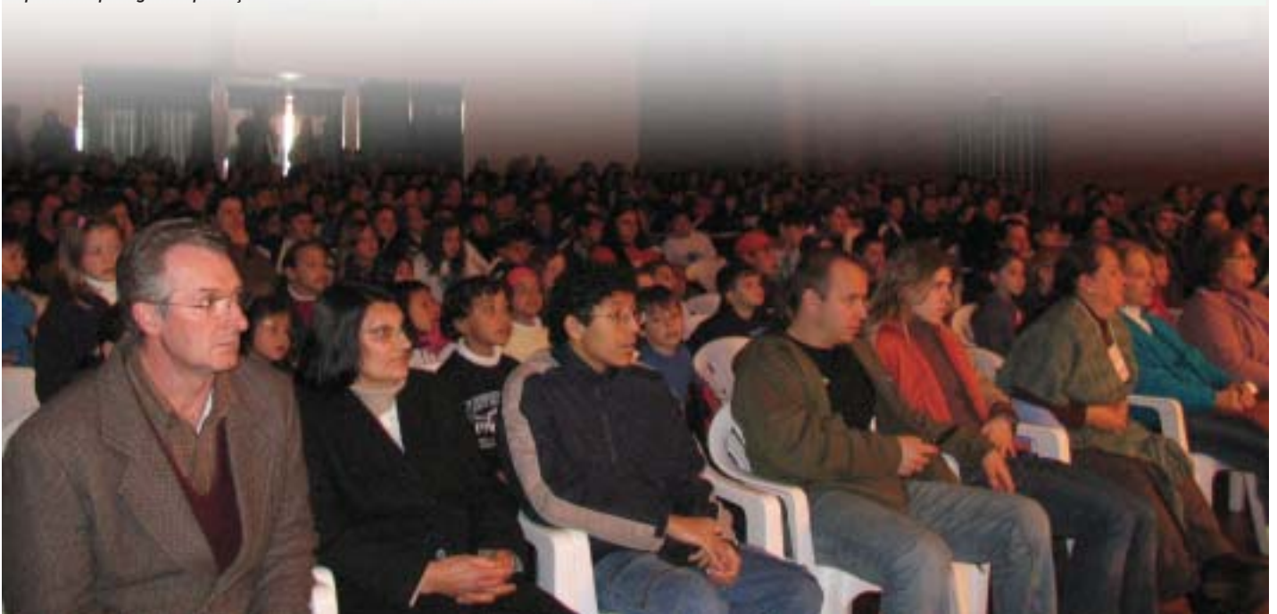
No teatro da UCS/Fervi, público assistiu atento aos excelentes espetáculos ali apresentados