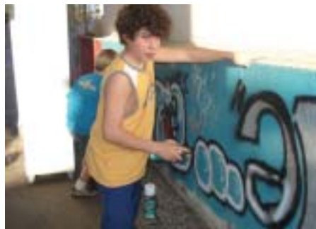
“Quem se liga, lê” e faz oficina de grafite na Biblioteca Municipal

Consiste no encontro de um escritor ou intelectual com alunos de Ensino Médio das escolas do município para um bate-papo a cerca de vivências, leituras e assuntos de interesse dos adolescentes. Ao final de cada encontro, é proposto um jogo rápido de pergunta/resposta entre o convidado e os alunos.