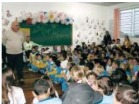
"A Feira vai à Escola" aproxima escritores renomados e alunos