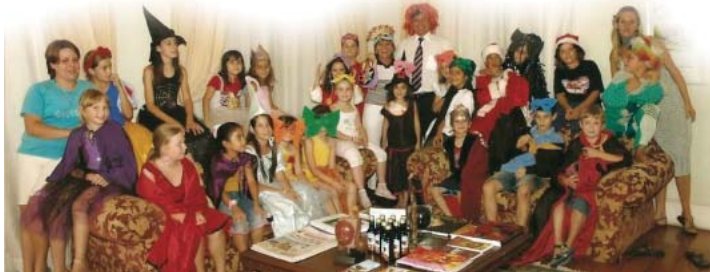
Prefeito Alcindo Gabrielli entrou na brincadeira com as crianças que fizeram oficina de Carnaval na Biblioteca

Dirigido para adolescentes, o projeto oferece oficinas culturais (grafite, declamação e expressão oral) que possibilitam formas diferenciadas de aproximação com a leitura. Acontecem semanalmente, todas as segundas-feiras, e ainda têm vagas! Quem quiser participar, o custo é de apenas R$20 reais por mês. No mês de novembro, será realizado um evento de culminância do projeto, quando todos os participantes poderão demonstrar seu aprendizado nas oficinas, através da realização de apresentações artísticas.