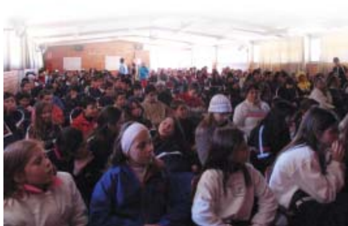
No Colégio Dona Isabel, alunos assistiram atentos o espetáculo que venceria o Festival