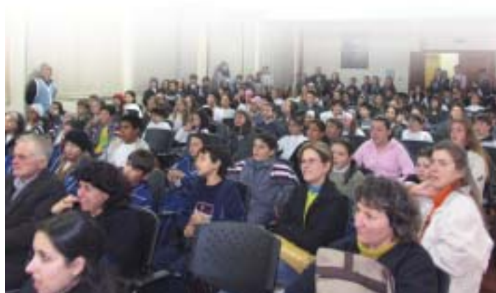
No Colégio Sagrado, o Espetáculo As Quatro Porquinhas envolveu o público

INDICADOS: AABB Comunidade, pelo espetáculo O Coração da Terra é Verde Grupo Fazendo Arte, pelo espetáculo Desabafo de Mulheres Rebeldes